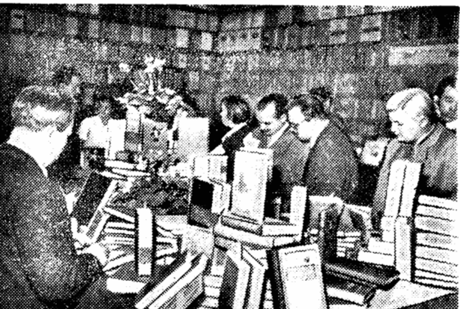
Базар советской книги в Бухаресте